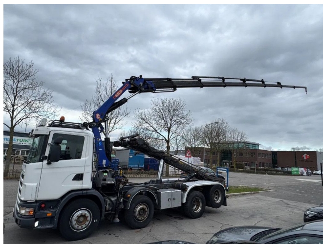
Scania R114-380 8X2 - EURO 3 + PM 23525SP LC 2013! + ...