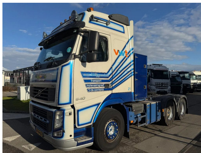
Volvo FH 540 6X2 - EURO 5 + BIG AXLE + LIFTING AXLE