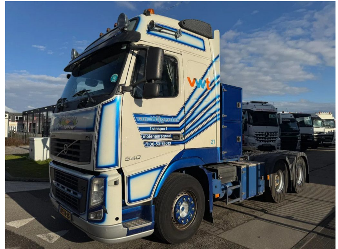
Volvo FH 540 6X2 - EURO 5 + BIG AXLE + LIFTING AXLE