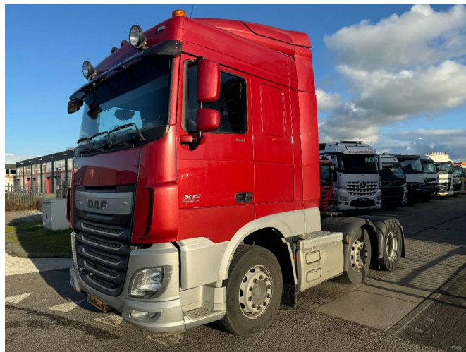
DAF XF 460 6X2 EURO 6 TÜV TILL 27-11-2025