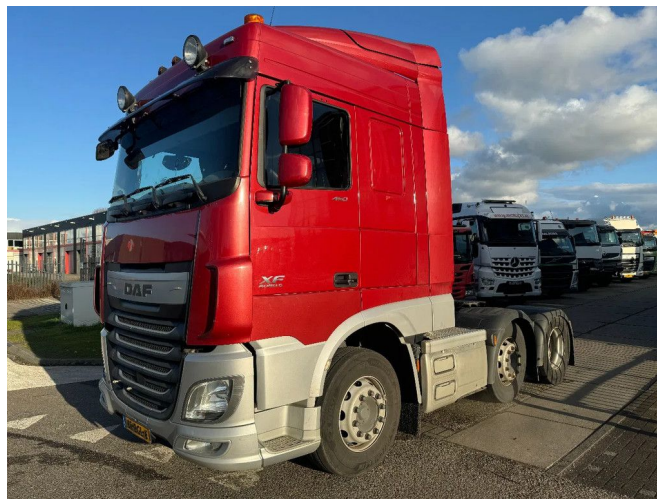
DAF XF 460 6X2 EURO 6 TÜV TILL 27-11-2025