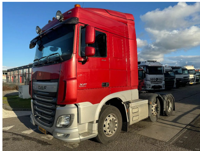
DAF XF 460 6X2 EURO 6 TÜV TILL 27-11-2025