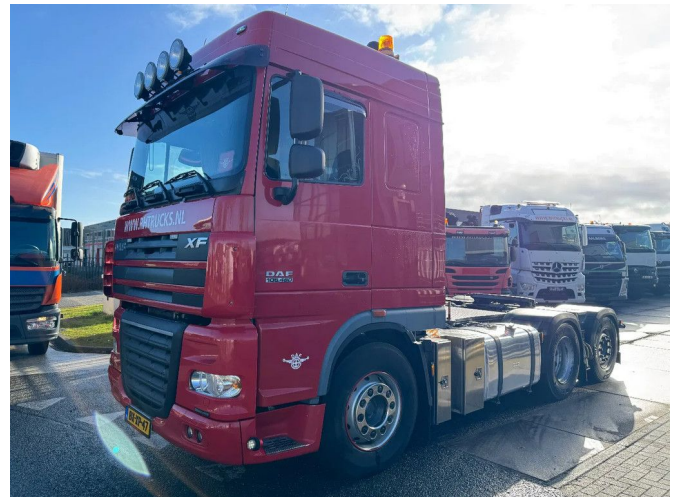
DAF XF 105.460 6X2 - EURO 5 + LIFT/STEERING AXLE