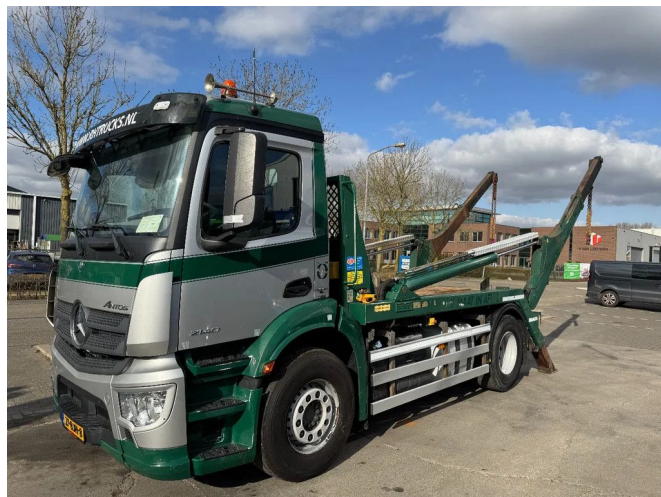
Mercedes-Benz Antos 2140 - 4X2 - EURO 6 + HYVALIFT NG...