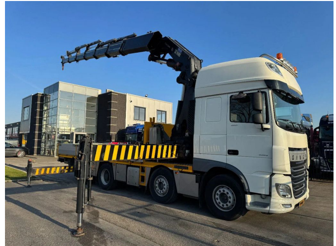
DAF XF 460 8X2 - EURO 6 + HIAB 855 EP-6 + REMOTE + S...