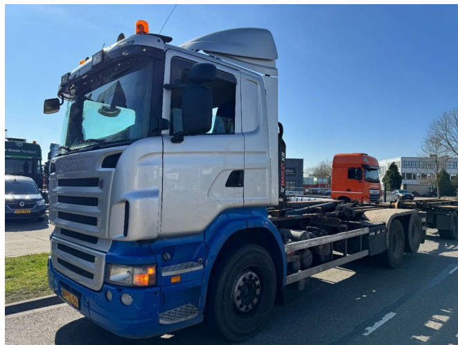
Scania R400 6X2 - EURO 5 + MULTILIFT HOOK + LIFTING ...