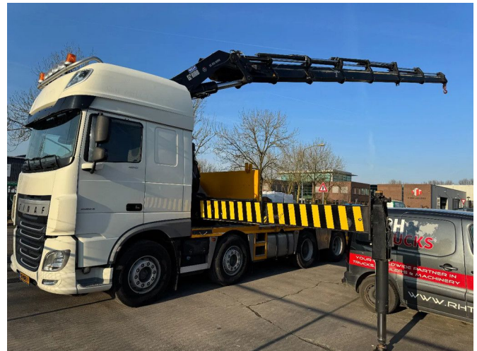
Ginaf X6 4243 CS 8X2 - EURO 6 + HIAB 855 EP-6 + REMO...