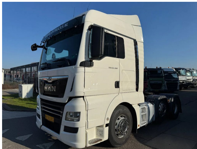
MAN TGX 26.460 6X2 - EURO 6 + RETARDER + LIFT AXLE