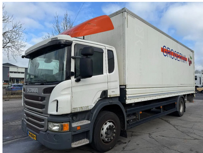
Scania P230 4X2 - EURO 5 + DHOLLANDIA LIFT