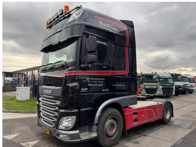
DAF XF 510 4X2 - EURO 6 + FULL SPOILER