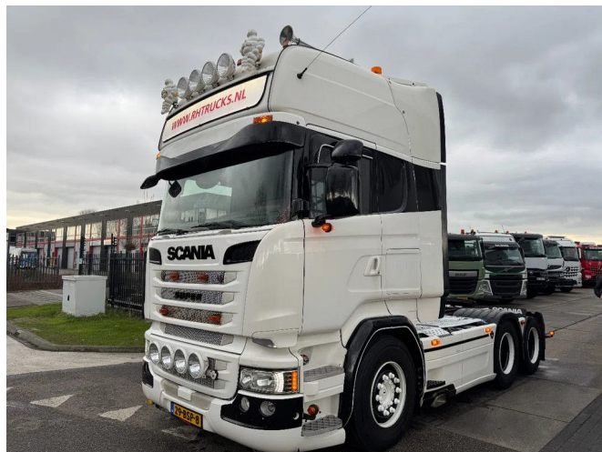
Scania R520 V8 6X2 - EURO 6 + RETARDER + LIFT AXLE + ...