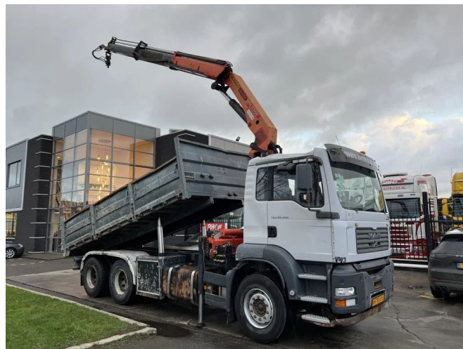
MAN TGA 26.390 6X4 + PALFINGER PK17502 + TIPPER - F... Referenznummer: MA449650