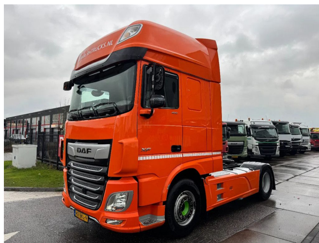
DAF XF 450 4X2 - EURO 6 + FULL SPOILER + NL TRUCK