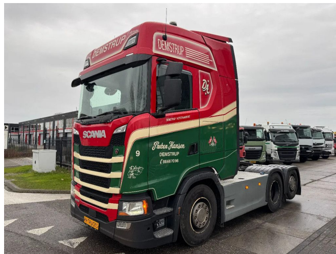
Scania S500 6X2 - EURO 6 + LIFT AXLE