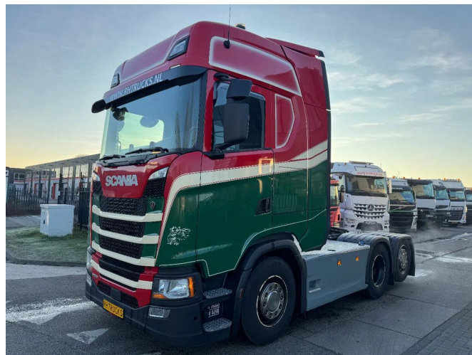
Scania S500 6X2 - EURO 6 + LIFT AXLE