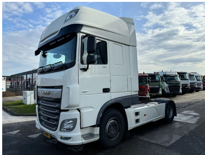
DAF XF 480 4X2 EURO 6 SKIRTS FRIDGE LED WHITE