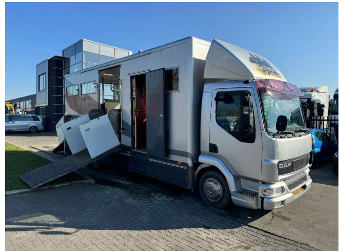
DAF LF 45 4X2 5 PAARDS MANUAL GEAR LIVING ROOM ...