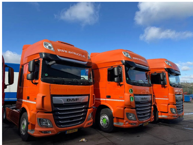
DAF XF 450 4X2 - EURO 6 + FULL SPOILER