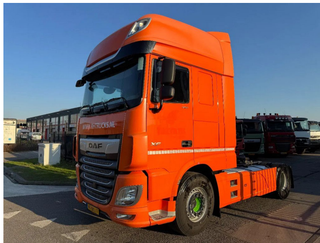
DAF XF 450 4X2 - EURO 6 + FULL SPOILER