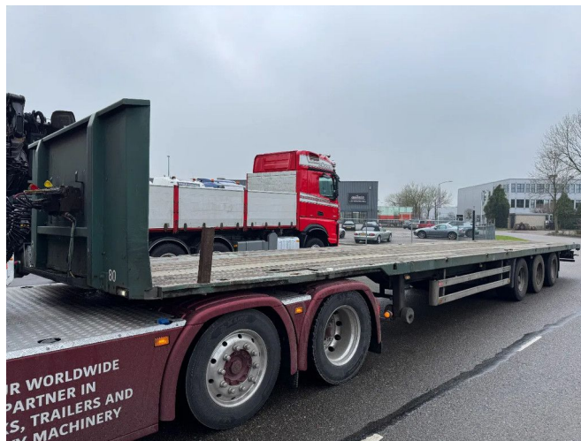
Pacton 3 AXLE BPW + TWISLOCKS