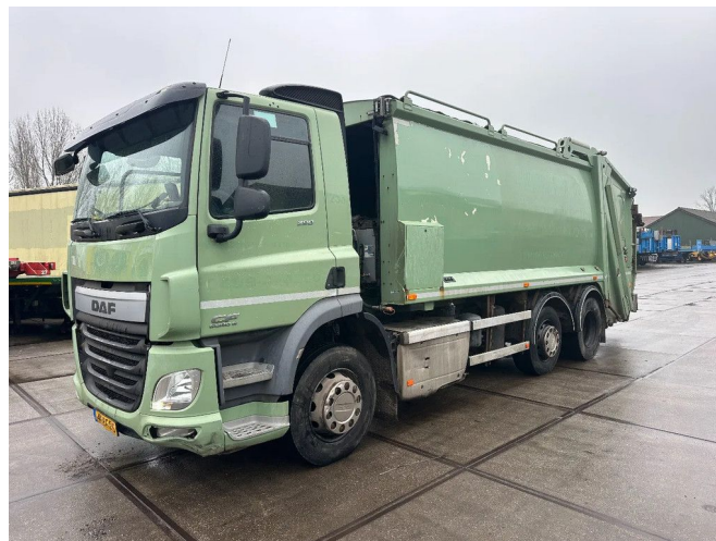
DAF CF 290 DAF CF 290 6X2 DENNIS EAGLE EURO 6 + W...