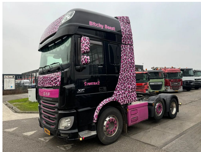
DAF XF 460 6X2 SPECIAL INTERIOR LIFT / STEERING AX...