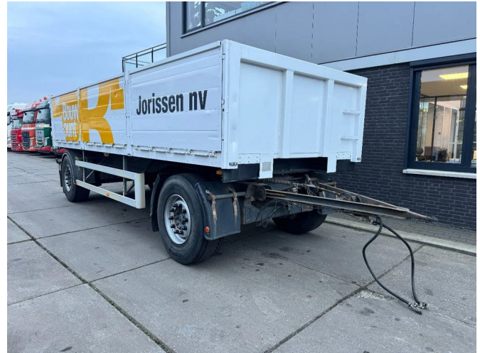
ATM 2 AS SCHAMEL + LAADBAK 6,50 METER