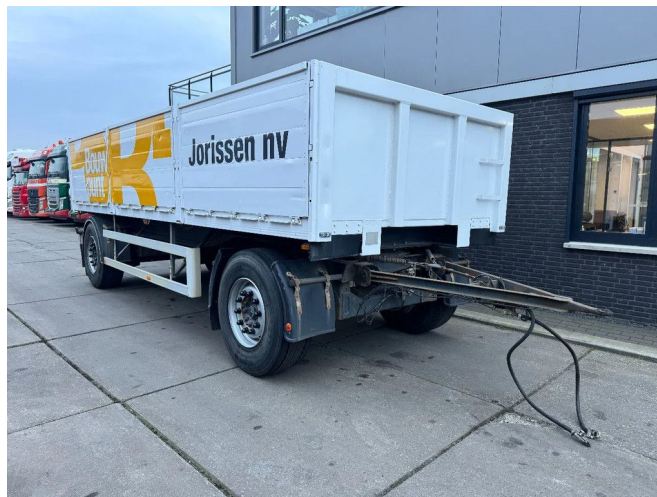
ATM 2 AS SCHAMEL + LAADBAK 6,50 METER