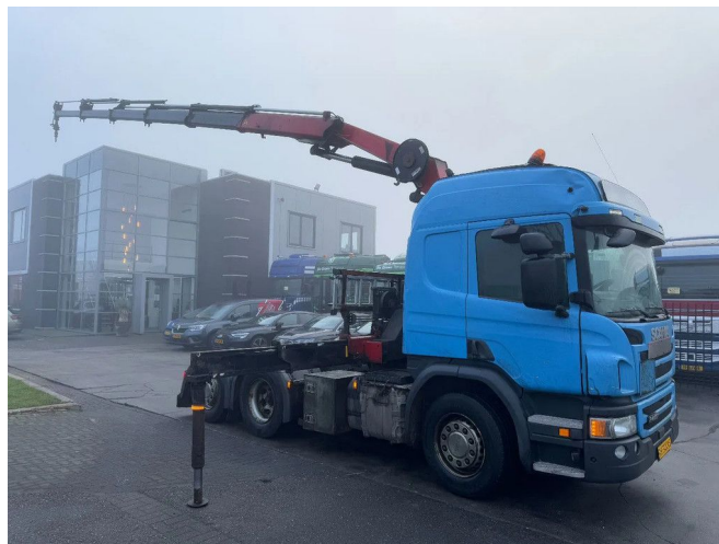
Scania P450 6X2 - EURO 6 + HMF 2620-K5 + REMOTE + LI...