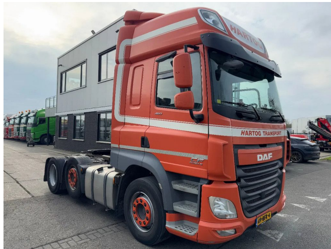
DAF CF 460 6X2 - EURO 6 + LIFT/STEERING AXLE