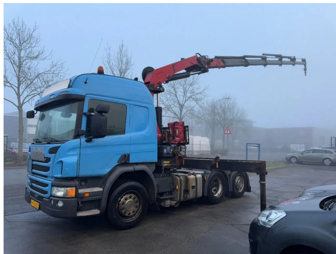
Scania P450 6X2 - EURO 6 + HMF 2620-K5 + REMOTE + LI...