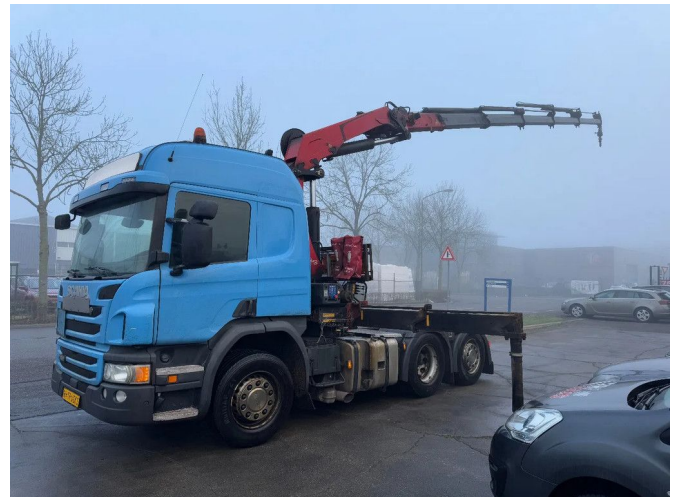
Scania P450 6X2 - EURO 6 + HMF 2620-K5 + REMOTE + LI...