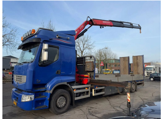
Renault Premium 370 6X2 - EURO 5 + FASSI F170A 23 + R...