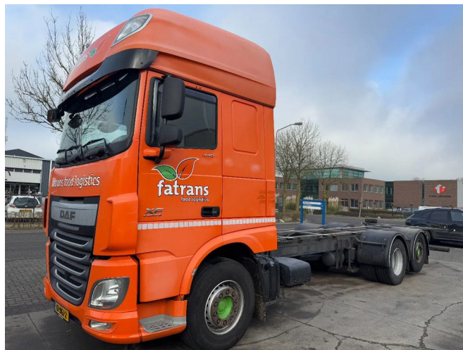
DAF XF 440 6X2 - EURO 6 + LIFT/STEERING AXLE + TÜV ...