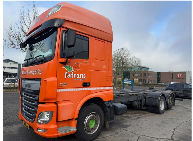
DAF XF 440 6X2 - EURO 6 + LIFT/STEERING AXLE + TÜV ...