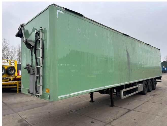
Knapen Trailers K100, 1E + 3E LIFT AXLE, REMOTE CONT...