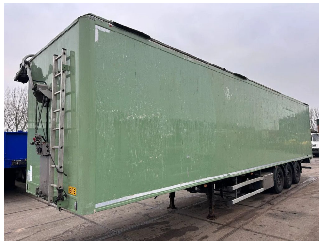
Knapen Trailers K100, 1E + 3E LIFT AXLE, REMOTE CONT...