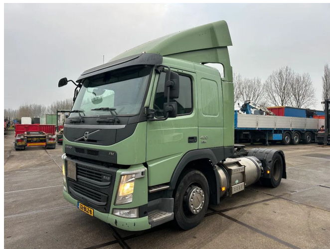
Volvo FM 420 4X2 PTO