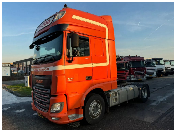
DAF XF 460 4X2 RETARDER DOUBLE TANK TÜV TILL 09-2...