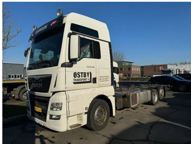
MAN TGX 26.500 6X2 EURO 6 BDF SYSTEM FULL AIR