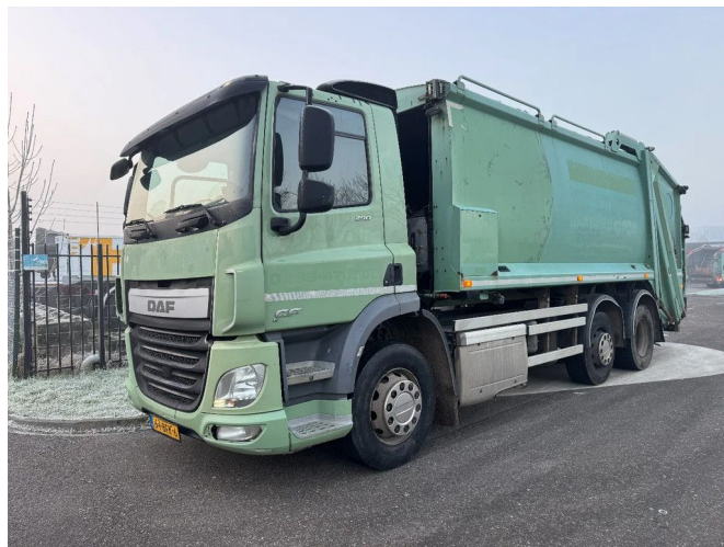
DAF CF 290 6X2 DENNIS EAGLE EURO 6 + WEIGHING SY...