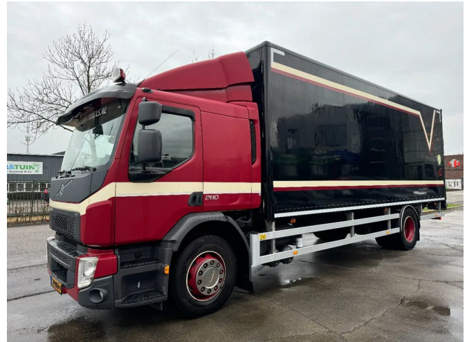
Volvo FE 280 4X2 BOX DHOLLANDIA LIFT TÜV TILL 01-2026