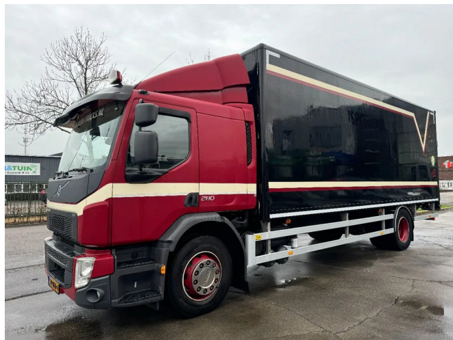
Volvo FE 280 4X2 BOX DHOLLANDIA LIFT TÜV TILL 01-2026