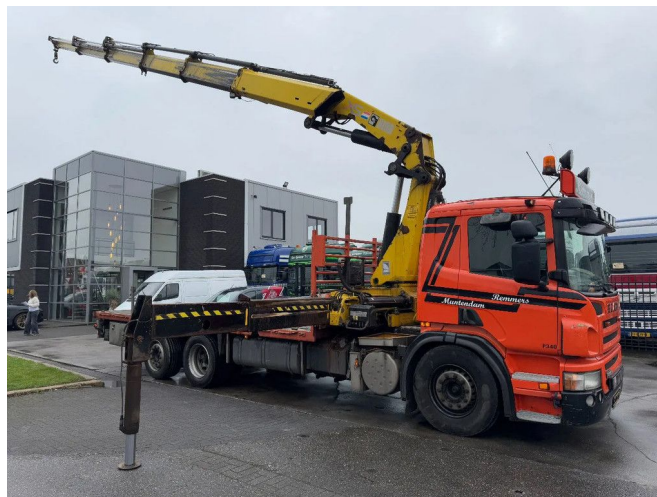
Scania P340 6X2 - HIAB 422 ED-5 + REMOTE + LIFT/STEER...