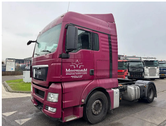
MAN TGX 18.440 4X2 - EURO 5