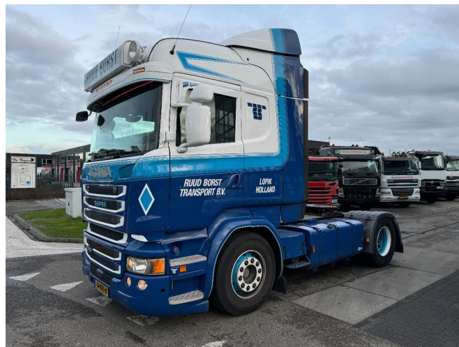
Scania R410 4X2 EURO 6 SPECIAL INTERIOR