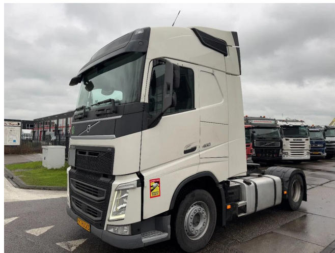
Volvo FH 460 4X2 - EURO 6 + TÜV 01-2026