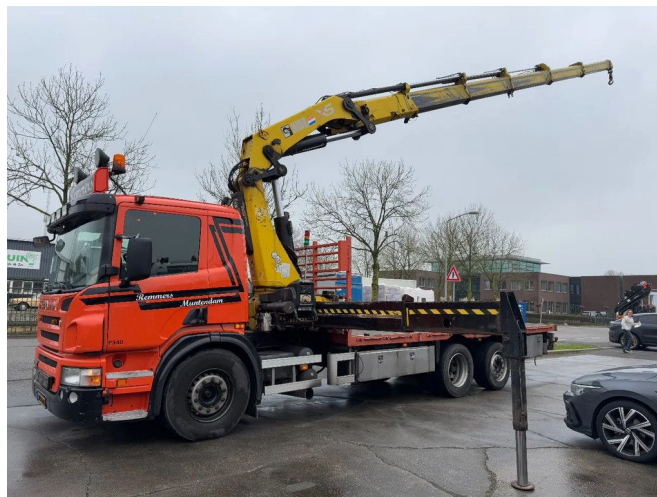
Scania P340 6X2 - HIAB 422 ED-5 + REMOTE + LIFT/STEER...