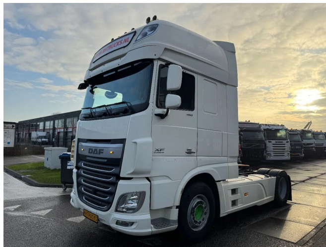
DAF XF 460 4X2 - EURO 6 + FULL SPOILER