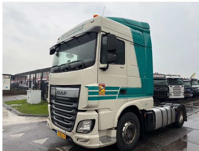
DAF XF 440 4X2 - EURO 6 + ADR + TÜV 09-2025